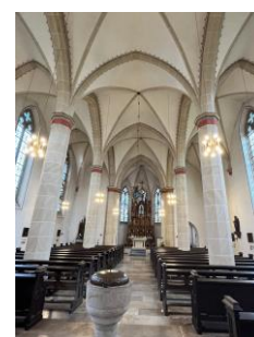
Fotos zur Einstimmung auf den Pilgerweg im September: mittelalterlicher Hohlweg in Paderborn; St. Margareta, Dahl; St. Dionysius, Sandebeck